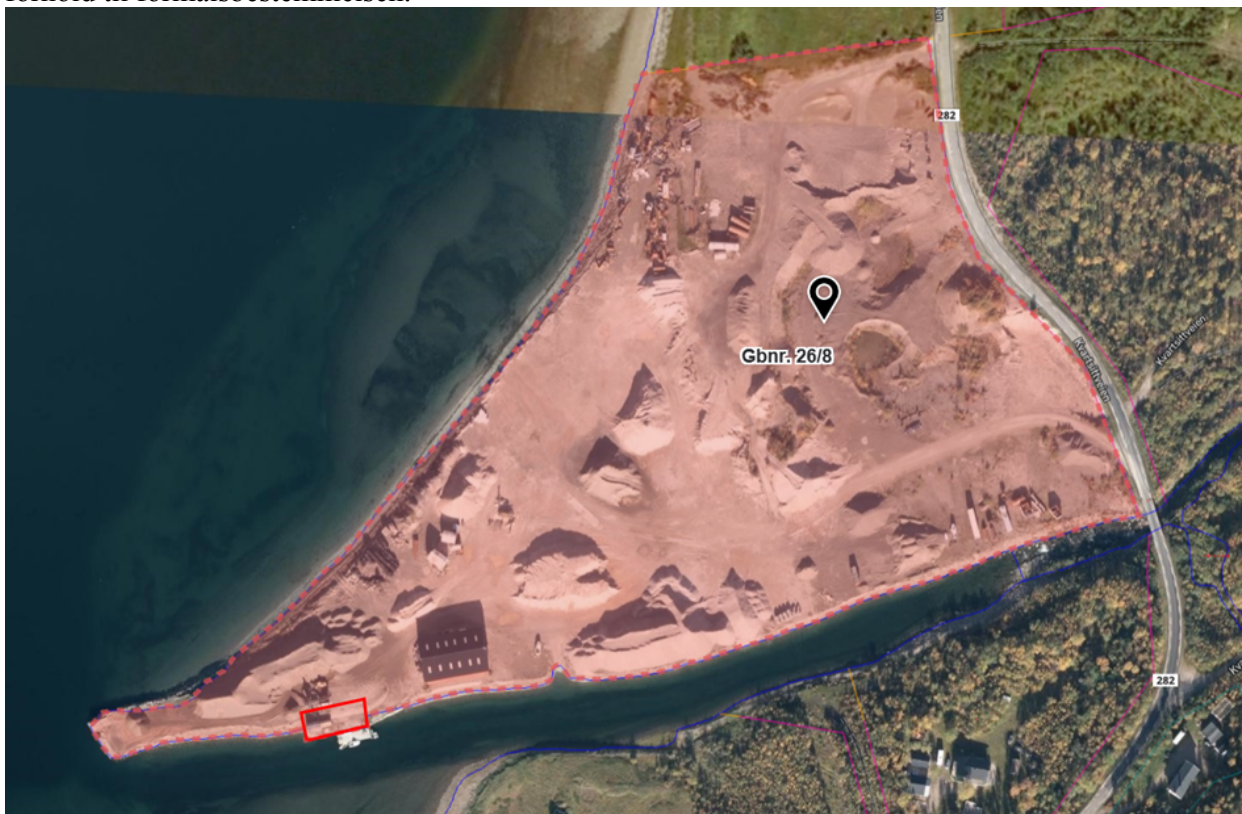
Bilde 1: Omsøkte området innrammet med rød linje.

I henhold til arealdelens planbeskrivelse pkt. 2.4.1.2 skal ervervsområdene opprettholdes. Utover dette sier ikke planen stort om disse områdene. Hovedformålet med disse områdene var å stimulere til næringsvirksomhet som kommunen har hatt praksis for å tillate i form av småskala virksomhet på gårds- og boligeiendommer. Spørsmålet er hvorvidt det omsøkte vil medføre at formålsbestemmelsen vil bli vesentlig tilsidesatt. Fysisk vil det omsøkte ikke legge beslag på mye av det totale landarealet i forhold til formålsbestemmelsen.